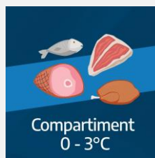
Compartment 0 - 3°C