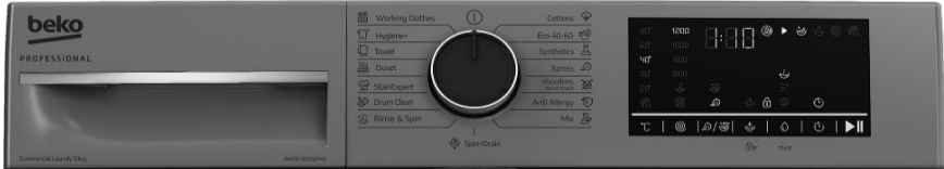
Bandeau de commande Programmation simple et intuitive