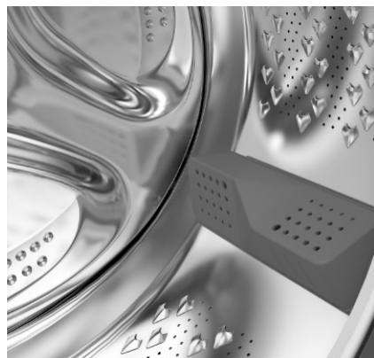
Tambour de 75 litres

*Par témoins visuels et messages affichés à l'écran