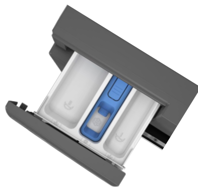
Bac à produits