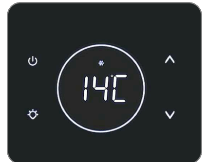
Nouveau bandeau de contrôle