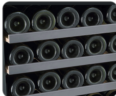
Clayette en bois - fronton inox