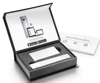
SmartDeviceBox à installer ultérieurement

Pour une salade ou des fraises toujours croquantes : les aliments les plus délicats méritent un endroit spécifique pour rester frais plus longtemps. C'est possible avec les compartiments BioFresh. Dans le compartiment Fruit & Vegetable, la température est proche de 0 °C. Grâce à la fermeture hermétique, les fruits et légumes non emballés qui y sont conservés restent particulièrement agréables à consommer en raison de l'humidité permanente qui y règne. Vous n'avez aucun réglage à faire.