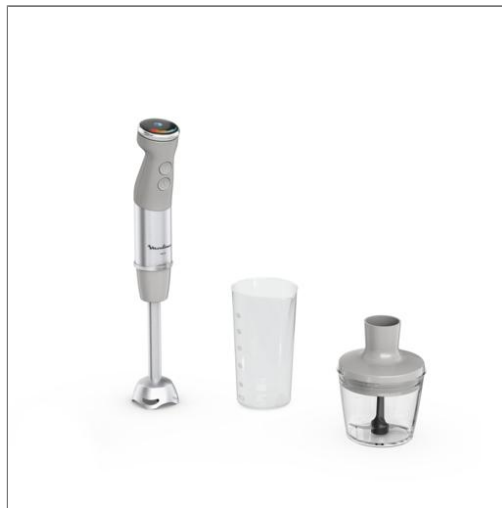
Quickchef+, Mixeur plongeant, 1000 W, 20 vitesses, 1 accessoire PIED MIXEUR DD672B10