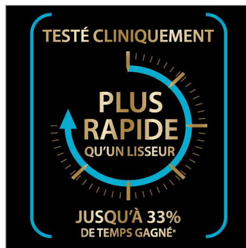
POWER STRAIGHT Brosse lissante CF5820C0