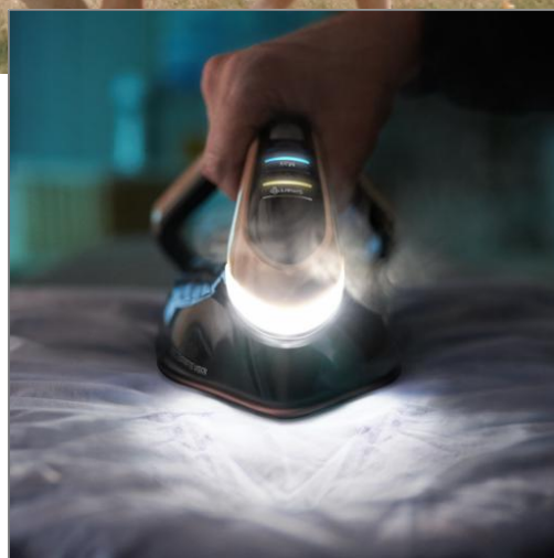
PRO EXPRESS VISION 3000 W NOIR ET DORÉ CENTRALE VAPEUR HAUTE PRESSION GV9820C0