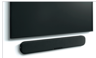
Possibilité de fixation murale