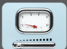
6 Browning temperature setting