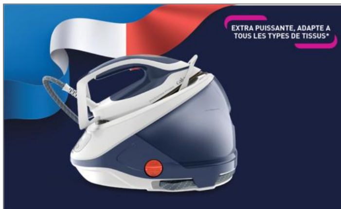
Pro Express Protect 7,5 Bars Bleue Centrale Vapeur GV9224C1