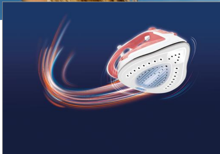
EASYGLISS PLUS CORAIL 2400 W FV5705C0

Le fer à repasser Easygliss Plus est équipé d'une semelle dotée de la technologie Durilium Airglide de Calor qui garantit une glisse parfaite et une plus grande puissance de vapeur, pour simplifier et raccourcir vos sessions de repassage. Sa puissance de 2 400 W offre un temps de chauffe rapide associé à un débit de vapeur continu de 40 g/minute pour des résultats rapides et à un jet de vapeur ultra-puissant de 185 g/minute pour venir à bout des plis les plus tenaces.