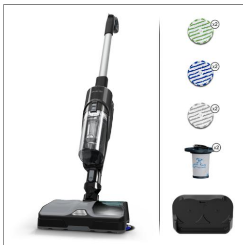
X-COMBO 2 en 1 aspirateur laveur GZ3039WO