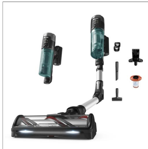
X-Force Flex 13.60, Aspirateur balai sans fil, 150 AW, 60 min, Modèle Allergie Aspirateur balai sans fil multifonction RH9A32WO