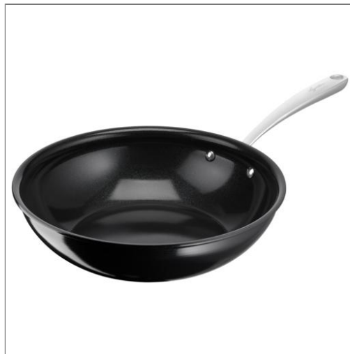
LAGOSTINA Poêle wok Desideria 28 cm, Revêtement en céramique antiadhésif, Conçu pour durer POÊLE WOK - 28 CM 010275041828