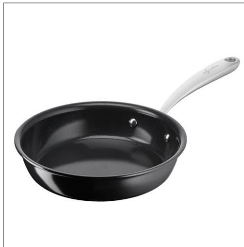
Poêle Desideria 20 cm, Revêtement en céramique antiadhésif, Conçue pour durer POÊLE - 20 CM 010275040120