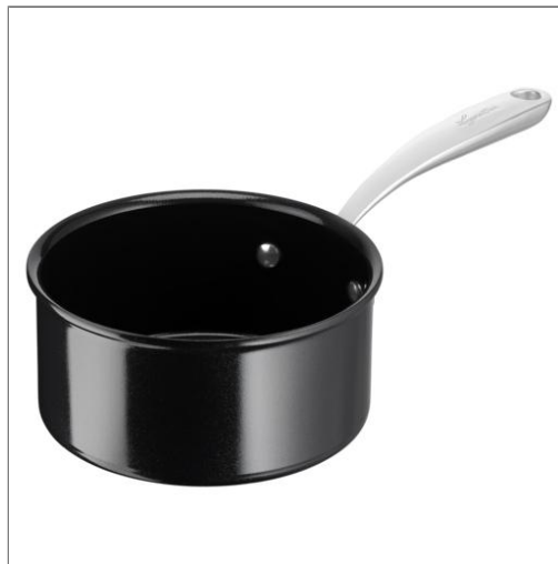
LAGOSTINA Casserole Desideria 16 cm, Revêtement en céramique antiadhésif, conçu pour durer CASSEROLE - 16 CM 010275031116