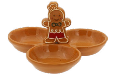
COUPELLE TRIPLE COMPARTIMENTS en dolomite Dim. 10 x 17 x 17 cm GING3COUP - 3 700 873 262 976