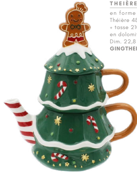
THEIÈRE 2 EN 1 en forme de sapin Théière 480 ml avec couvercle + tasse 210 ml en dolomite Dim. 22,8 x 12,8 x 19 cm GINGTHEI - 3 700 873 262 990