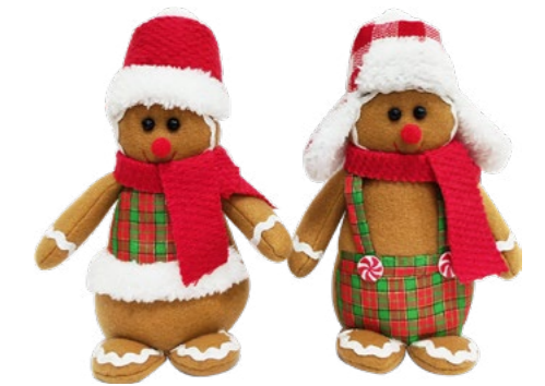
DÉCORATION GINGERBREAD MAN en polyester - Dim. h20 cm 2 modèles panachés GINGDECO20 - 3 700 873 263 003