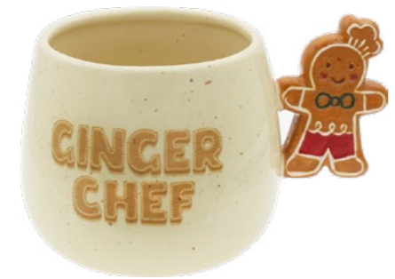
TASSE AVEC ANSE GINGERBREAD MAN en dolomite Dim. 9,8 x 11,2 x 16,8 cm - 190 ml GINGTAS - 3 700 873 262 945