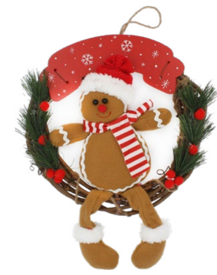
DÉCORATION GINGERBREAD MAN à suspendre en polyester et bois - ø 25 cm 2 modèles panachés GINGDECO25 - 3 700 873 263 041