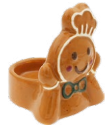
BOUGEOIR en dolomite Dim. 9,3 x 7,7 x 8 cm GINGCHAND - 3 700 873 262 983