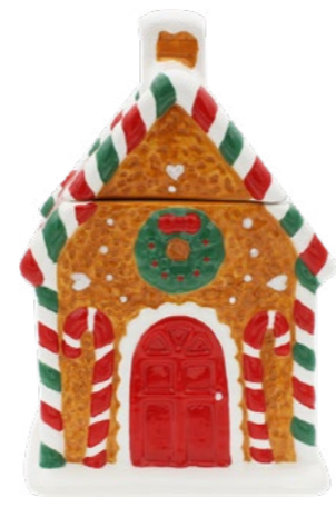
BOITE À BISCUITS en forme de Gingerbread House en dolomite Dim. 20,2 x 12,9 x 13,2 cm GINGBOITMAIS - 3 700 873 262 907