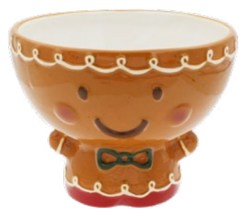
BOL GINGERBREAD MAN en dolomite Dim. 10,9 x 14,6 x 14,6 cm - 235 ml GINGBOL - 3 700 873 262 952