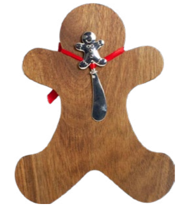
PLANCHE GINGERMAN en bois avec couteau métal Dim. 26 x 21 x 2 cm GLPLCOUTI - 3 700 873 248 079