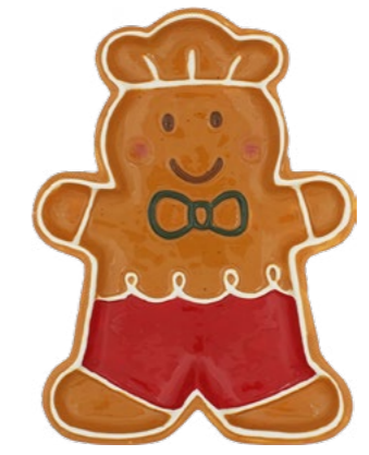
PLAT GINGERBREAD MAN en dolomite Dim. 3 x 15,6 x 21,6 cm GINGPLA - 3 700 873 262 969