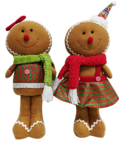
DÉCORATION GINGERBREAD MAN en polyester - Dim. h48 cm 2 modèles panachés GINGDECO48 - 3 700 873 263 010