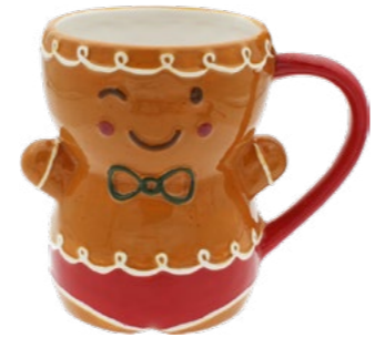
MUG GINGERBREAD MAN en dolomite Dim. 12,8 x 9,6 x 13,1 cm - 160 ml GINGMUG - 3 700 873 262 938