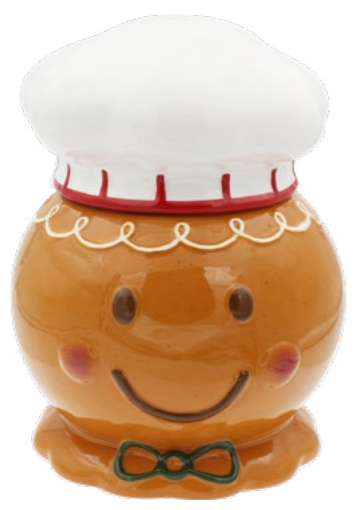
BOITE À BISCUITS en forme de visage Gingerbread Man en dolomite Dim. 24,9 x 18,2 x 18,4 cm GINGBOITMAN - 3 700 873 262 891