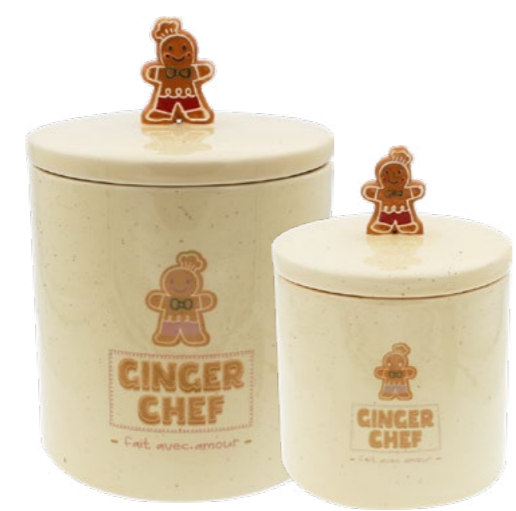
BOITES À BISCUITS en dolomite GRANDE ø 15,8 x 22,5 cm GINGBOITGM - 3 700 873 262 914 PETITE ø 11,2 x 15,5 cm GINGBOITPM - 3 700 873 262 921