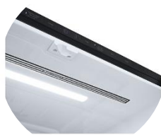
Éclairage Soft LED