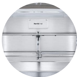
Filter anti-odeur Pure N Fresh