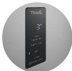
Interface digitale extérieure