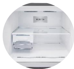
Fabrique à glace Twist Ice™