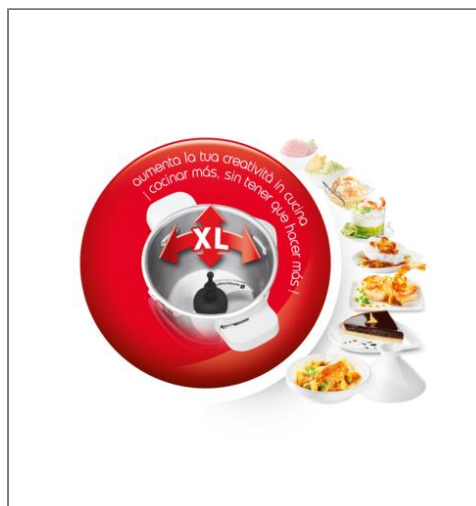
COMPANION XL GOURMET 1550 W NOIR Robot Cuiseur multifonction HF809820