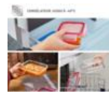
EMPLIABLE - REBORD SOLIDE