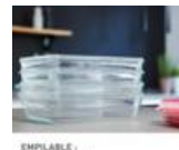
EMPLIABLE - REBORD SOLIDE