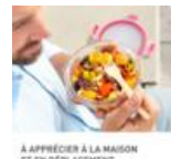
À APPRÉCIER À LA MAISON ET EN DÉPLACEMENT