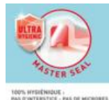
100% HYGIENIQUE - PAS D'INTERSTICE - PAS DE MICROBES