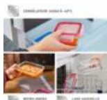
COMPATIBLE FOUR JUSQU'À 420°C