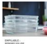
EMPILABLE - BORD SOLIDE