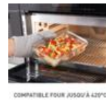
COMPATIBLE FOUR JUSQU'À 420°C