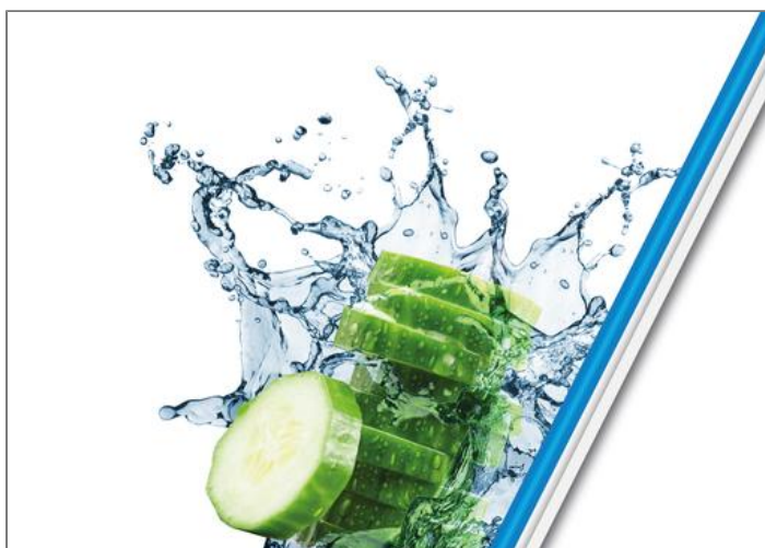
MASTERSEAL FRESH Boîte de conservation alimentaire Boîte ronde 0,85 L K3022312