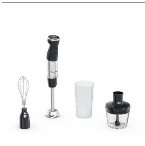
Quickchef +, Mixeur plongeant, 1000 W, 20 vitesses, 2 accessoires PIED MIXEUR DD673810