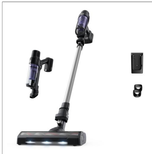
X-Pert 7.60, Aspirateur balai sans fil, 140 W, Jusqu'à 45 min Aspirateur balai sans fil multifonction RH6A21WO