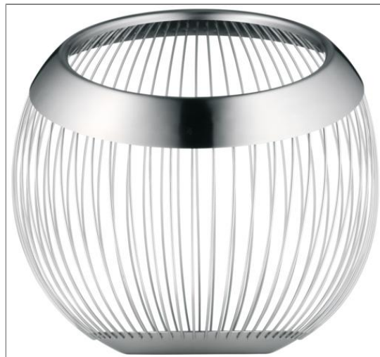
WMF corbeille à fruit, 19 cm Corbeille à fruits, diam 19 CM 0665086030