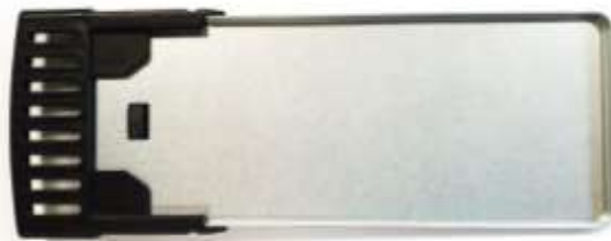
Tiroir ramasse miettes

Ne pas oublier de repositionner le tiroir ramasse miettes après nettoyage...l'appareil ne doit jamais fonctionner sans le tiroir ramasse miettes. Ne jamais laisser les miettes s'accumuler... le tiroir ramasse miettes est à vider après chaque utilisation... avant si nécessaire