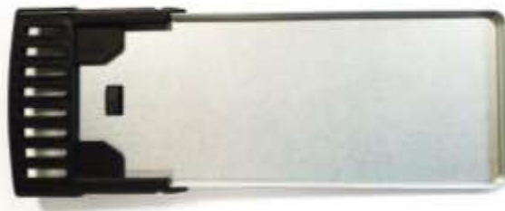
Tiroir ramasse miettes

Ne pas oublier de repositionner le tiroir ramasse miettes après nettoyage...l'appareil ne doit jamais fonctionner sans le tiroir ramasse miettes. Ne jamais laisser les miettes s'accumuler... le tiroir ramasse miettes est à vider après chaque utilisation... avant si nécessaire