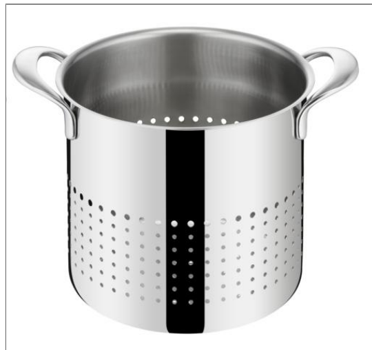
Emozione Pastaiola Panier 011204260520