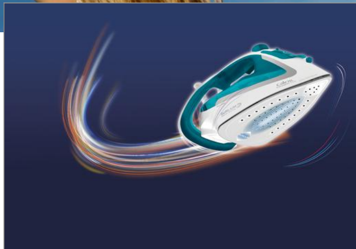
EASYGLISS 2 FV5721C0