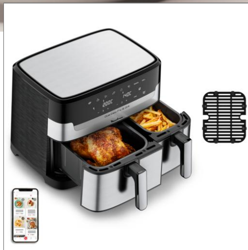
FRITEUSE A AIR DUAL EASY FRY & GRILL 8,3 L en acier inoxydable Friteuse à air Dual Easy Fry & Grill 8.3 L en acier inoxydable EZ905D20