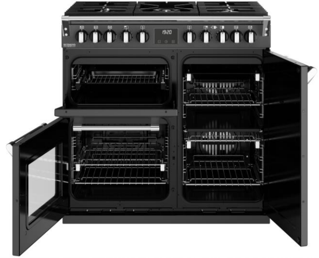
TABLE DE CUISSON 5 FOYERS GAZ