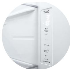
Affichage intérieur discret