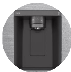
Distributeur d'eau épuré