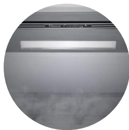
Éclairage Soft LED