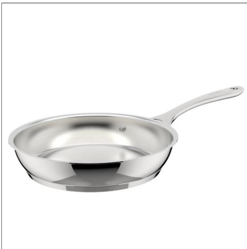
Lagostina Orchestra Poêle inox 28 cm Poêle 28 cm 011108040128