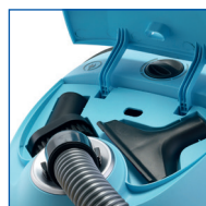
2 ACCESSOIRES EMBARQUÉS