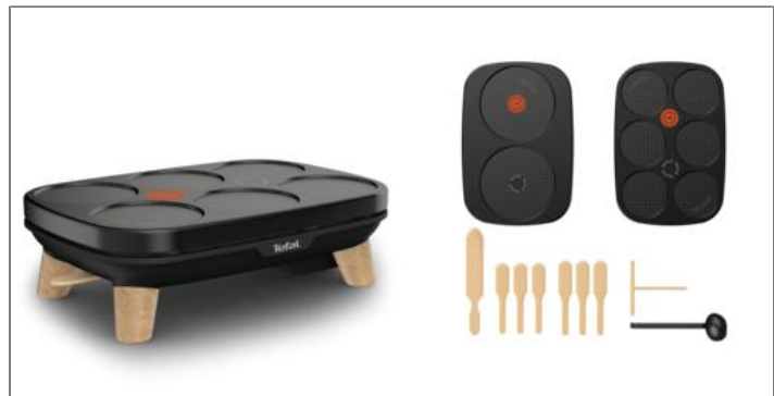
GOURMET Crêpière 6 empreintes PY900812