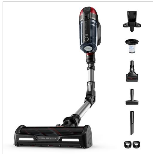
X-Force Flex Auto 12.60, Aspirateur balai sans fil, puissant 150AW, 45min, animaux Aspirateur balai sans fil multifonction RH98A7WO