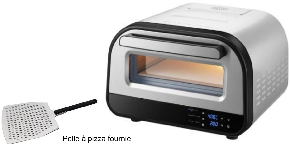
Pelle à pizza fournie