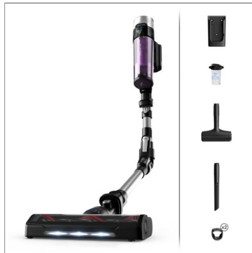
X-FORCE FLEX 9.60 KIT ALLERGIE Aspirateur balai multifonction RH2037WO