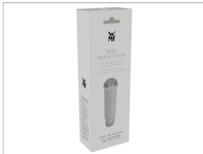
WMF Perfection Cartouche filtrante Cartouche filtrante XW133000