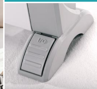
Interrupteur marche/arrêt au pied : l'astuce pratique pour ne pas avoir à se baisser