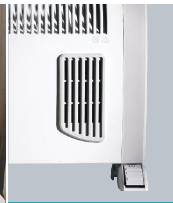
Fonction Turbo "Grille de diffusion de chaleur"