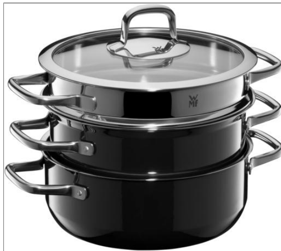
Fusiontec Compact Set 3 pièces Noir Faitouts 22 cm haut + 22 cm bas + panier vapeur 0515615290