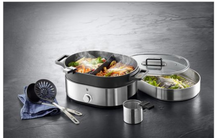
Lono Hot Pot & Steam 0415540011