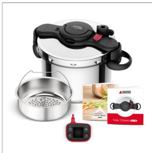
CLIPSO NOW+ Cocotte-minute® 9 L Autocuiseur 9 L P4904950