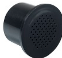
Filtre à charbon actif - FILTRE1 Il est recommandé de le changer tous les ans.

** Grâce à l'application Vinotag®, bénéficiez d'un registre digital de votre cave et soyez alerté des dates d'apogée de vos vins. En partenariat avec Vivino scannez votre bouteille pour accéder à sa fiche vin préremplie.