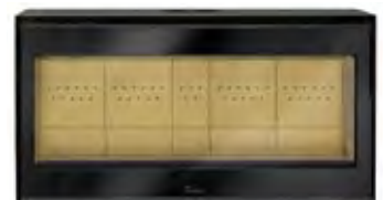
Nouveau! Adour 1000