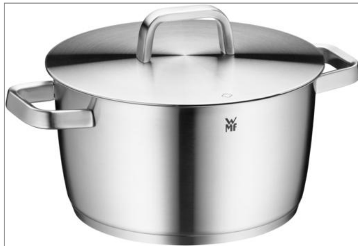
Iconic Faitout haut 24 cm avec couvercle Faitout haut 24 cm 0740246030