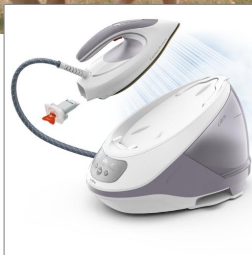
EXPRESS PROTECT 2800 Watts Blanc et gris SV9203C0