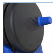
ENROULEUR DE FLEXI- BLE ULTRA SOUPLE